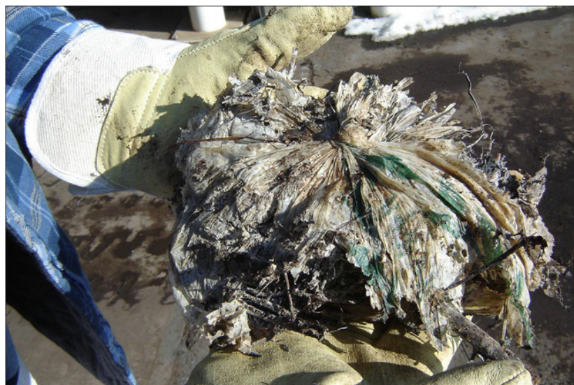
Biokunststoffbeutel verrotten im Kompostwerk Mechernich nicht. Sie müssen aufwendig und oft mit Verlust von Bioabfall aussortiert werden

Bei Fragen wenden Sie sich an Ihre Abfallberatung: abfallberatung@kreis-euskirchen.de / Tel: 02251-15-530